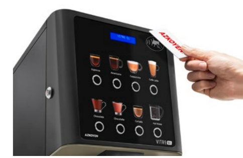
Kit Lector RFID Para tarjeta de recarga producto o sistemas cashless.