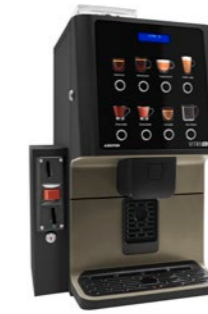
Kit módulo validador Preparado para instalar un validador de monedas.