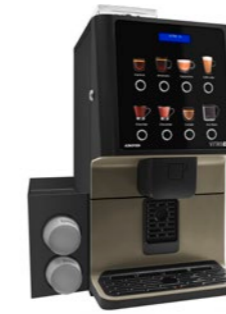
Kit módulo de vasos Para dispensar vasos.