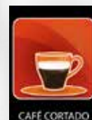
Conjunto de etiquetas 4