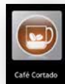
Conjunto de etiquetas 2