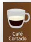
Conjunto de etiquetas 3